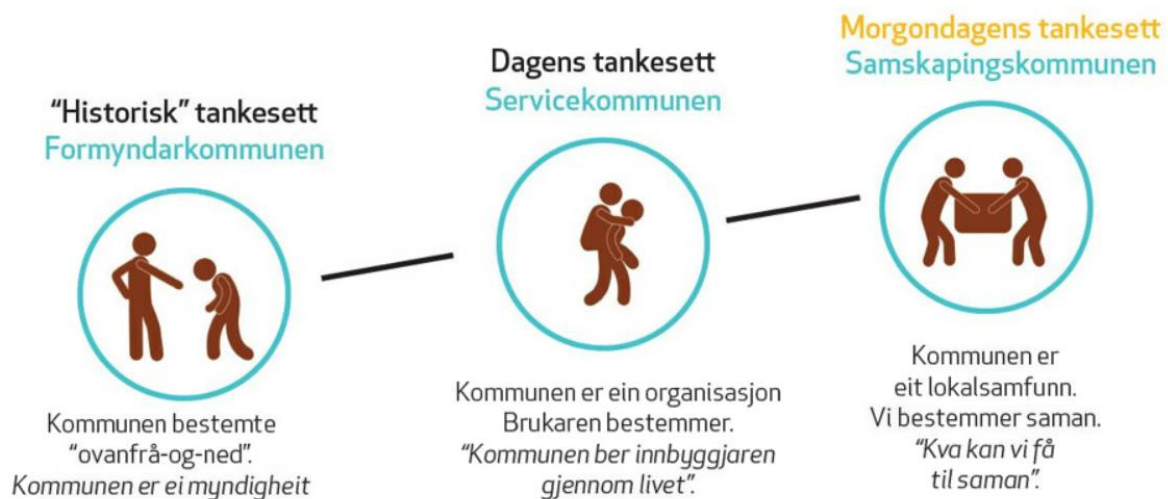
Figur 4: Vegen til samskapingskommunen 8

Samskaping krev nytenking. Vi må sjå utover kommunen som organisasjon. Ved å mobilisere ressursane i lokalsamfunnet kan vi skape gode liv i vår kommune.