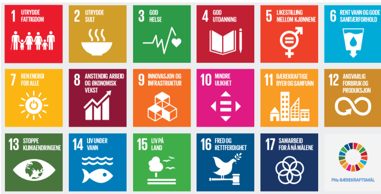
Figur 1: FN sine berekraftmål 1

FN sine berekraftmål skal også i Noreg vere hovudsporet for å ta tak i dei største utfordringane i vår tid. Regjeringa vil utvikle indikatorar for berekraftmåla, slik at effekten av kommunane sin eigen innsats i dette arbeidet mot felles mål kan målast.