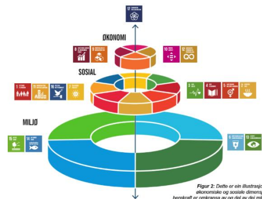
Figur 2: FN sine berekraftsmål plassert i forhold til miljømessig, sosial og økonomisk berekraft 4

Meldingar til Stortinget syner prioriterte politikkområde på nasjonalt nivå. Tema som har vore tatt opp dei siste fire åra er mellom anna: tidleg innsats i oppveksten, distrikt, fiskerinæring, folkehelse, helsenæringa, ulikskap og låg inntekt, frivillig innsats i samfunnet, kultur, kvalitet i livet som eldre, IKT-tryggleik, FN sine berekraftsmål, reiseliv, berekraftige byar og sterke distrikt, samfunnstryggleik, digital agenda, naturmangfald og likestilling.