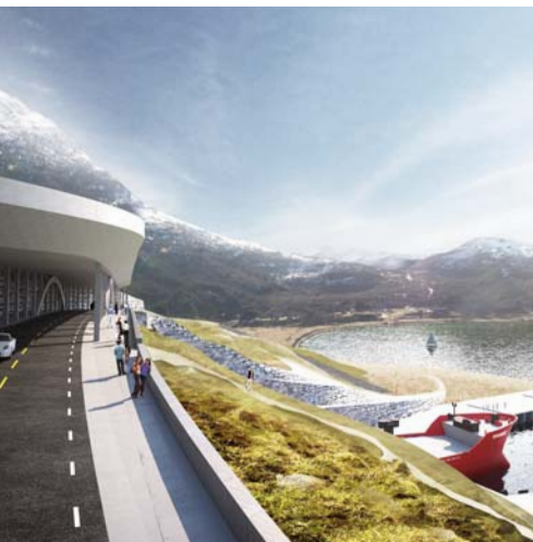
Illustrasjon: Kystverket / Snøhetta