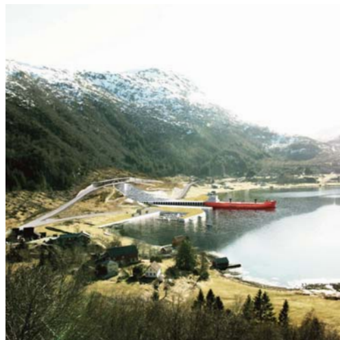
Illustrasjon: Kystverket / Snøhetta